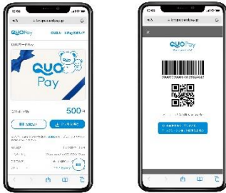
スマホ画面表示イメージ