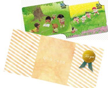
専用カードケース（無料）