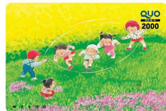
2,000円券「なわとび」 希望小売価格：2,000円