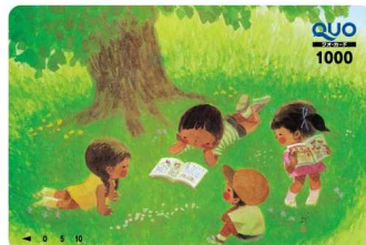
1,000円券「読書」 希望小売価格：1,040円