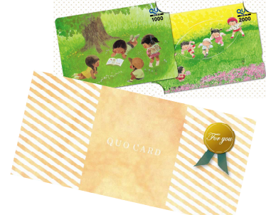
専用カードケース（無料）