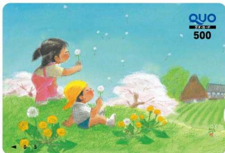
500円券「なかよし」 希望小売価格：530円