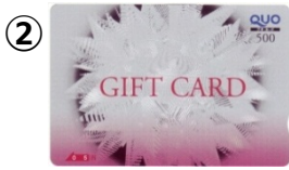
② 500円券(銀の輪) 販売価格：530円 ご利用可能額：500円