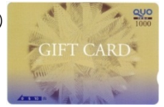
④ 1,000円券(金の輪) 販売価格：1,040円 ご利用可能額：1,000円