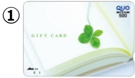
① 500円券(クローバー) 販売価格：530円 ご利用可能額：500円

※予約承り票(店舗控え)の太枠内に必要事項をご記入の上、レジにお持ちください。 ※ご予約終了後の変更・キャンセルは承れません。予めご了承ください。