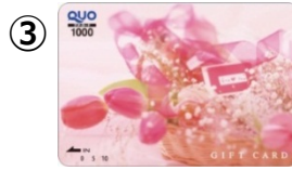
③ 1,000円券(チューリップ) 販売価格：1,040円 ご利用可能額：1,000円