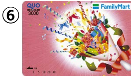
⑥ 3,000円券 販売価格：3,000円 ご利用可能額：3,000円