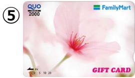
⑤ 2,000円券 販売価格：2,000円 ご利用可能額：2,000円