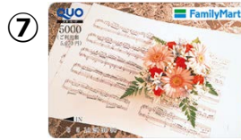
⑦ 5,000円券 販売価格：5,000円 ご利用可能額： 5,070円