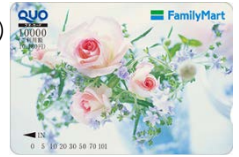
⑧ 10,000円券 販売価格：10,000円 ご利用可能額： 10,180円

※クオ・カードは非課税となります。 ※500円券・1,000円券は、カードの製造にかかわるコストの一部をお客様にご負担いただいております。